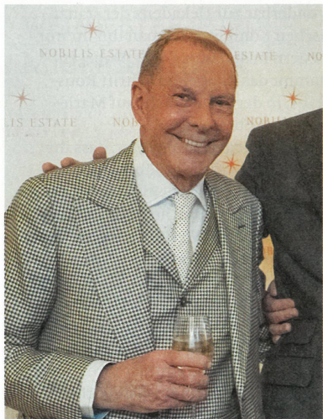
Führte durch den Abend: TV-Legende Kurt Aeschbacher.